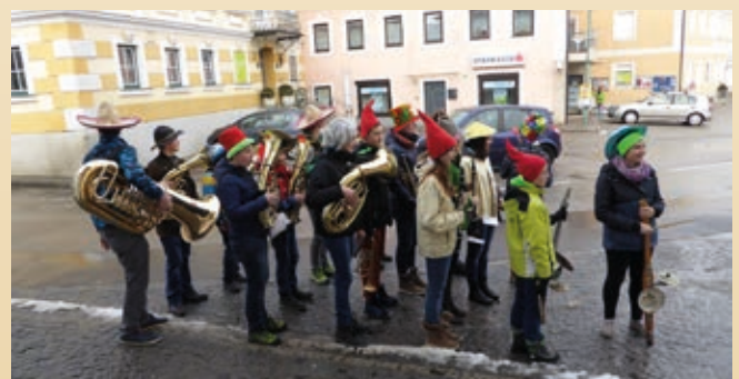
Faschingsumzug mit der UNION Ried/Riedmark