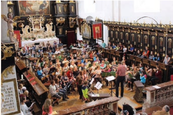
Abschlusskonzert in der Stiftskirche

Jedes Jahr in der ersten Sommerferienwoche findet das bewährte Waldhausenseminar statt. Über 200 motivierte Jungmusiker aus dem Bezirk Perg verbringen hier eine Woche in Waldhausen, um sich musikalisch weiterzubilden und neue Freundschaften zu knüpfen. Das Highlight der Woche ist das Abschlusskonzert in der Stiftskirche, wofür sie die ganze Woche lang intensiv proben. 50 Prozent der Kosten übernimmt der Verein.